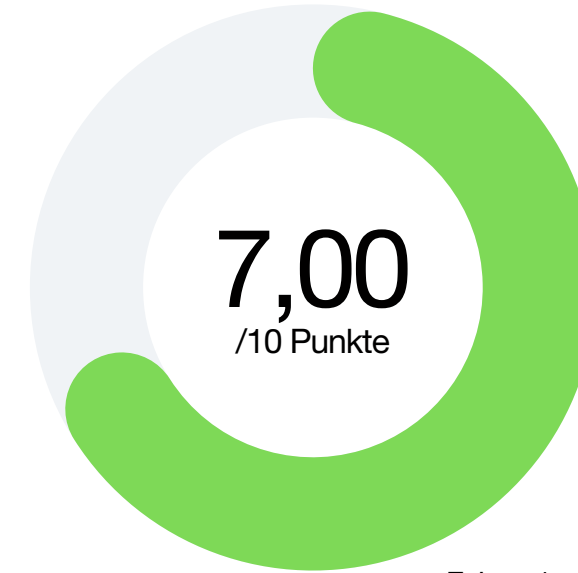
Faktor 1 Digitalisierung