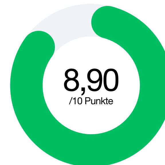
Faktor 1 Erreichbarkeit