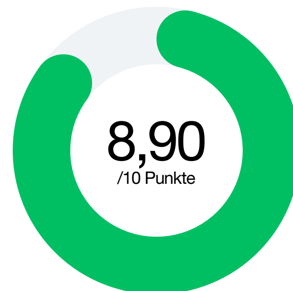
Faktor 1 Kundenfeedback