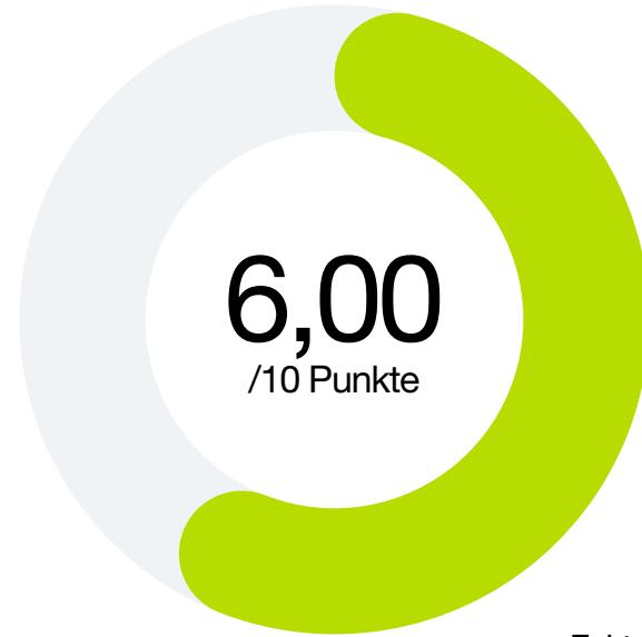
Faktor 1 Public Awareness