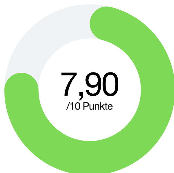
Faktor 1 Transparenz