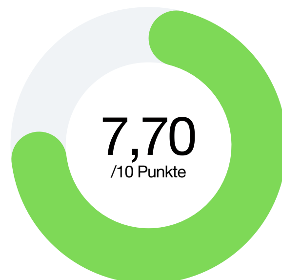
Faktor 1 Kommunikation