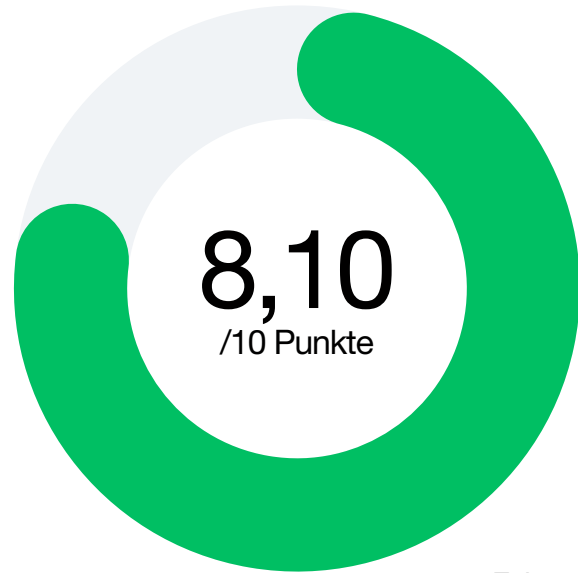
Faktor 1 Kundenbindungs- maßnahmen